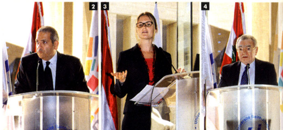
4- LE PR RENÉ CHAMUSSY, RECTEUR DE L'UNIVERSITÉ SAINT-JOSEPH.