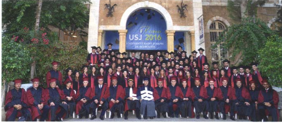
الخريجون مع عمداء ومدراء ومسؤولي الجامعة

خوري: للتعاون من أجل قيادة المشهد الثقافي