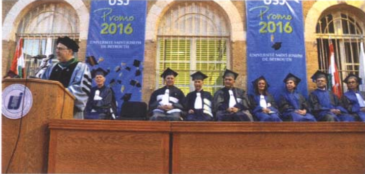
البروفسور فضلو خوري

بدوره اعتبر البروفسور خوري أن العلاقة بين رؤساء الجامعتين ساهمت في «قيادة المشهد