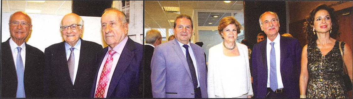
النقيب الياس عون، الوزير رمزي جريج والوزير السابق بهيج طيارة