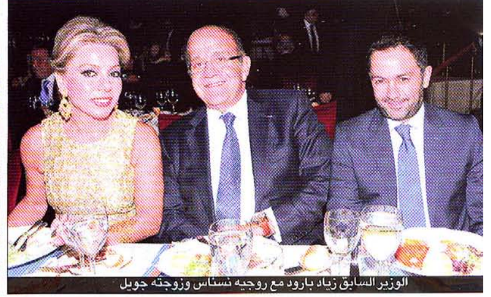
الوزير السابق زياد بارود مع زوجته نسناس وزوجته جويل