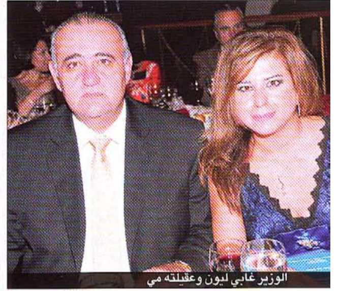
الوزير غابي ليون وعقيلته مي