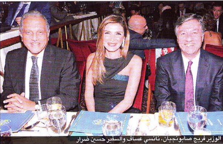
الوزير فريخ صابونجيان، نانسي عساف والسفير حسين ضرار

تحت عنوان «قدامى جامعة القديس يوسف اتحدوا»، أقام اتحاد جمعيات القديس يوسف عشاءه السنوي في كازينو لبنان، بدعوة من رئيس مجلس الشورى القاضي شكري صادر الذي ألقى كلمة شكر فيها كل من ساهم في إنجاح الحدث، وحضر الحفل حشد من الوزراء، النواب، السفراء، القضاة وشخصيات اقتصادية، إعلامية واجتماعية.