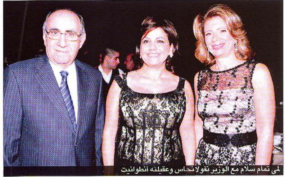
لمى تمام سلام مع الوزير نقولا نحاس وعقيلته أنطوانيت