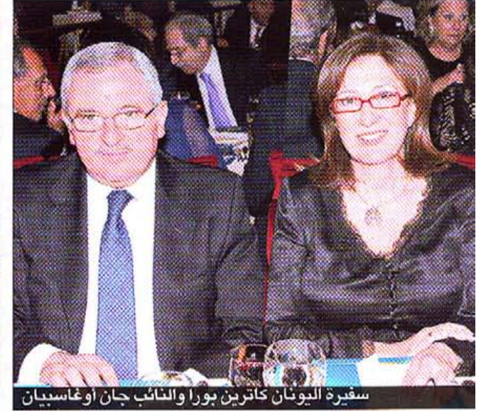
سفيرة اليونان كاترين بورا والنائب جان اوغاسبيان