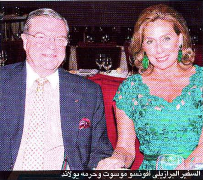
السفير البرازيلي افونسو موسوت وحرمة يولاند