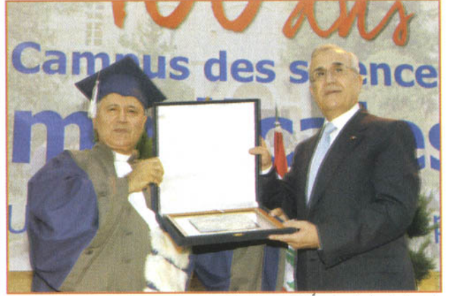
رئيس الجامعة يقدم درعاً للرئيس سليمان