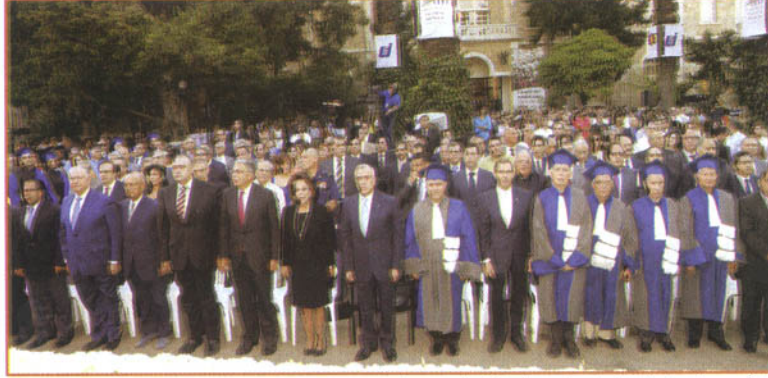
الرئيس سليمان في مقدمة حضور احتفال اليسوعية