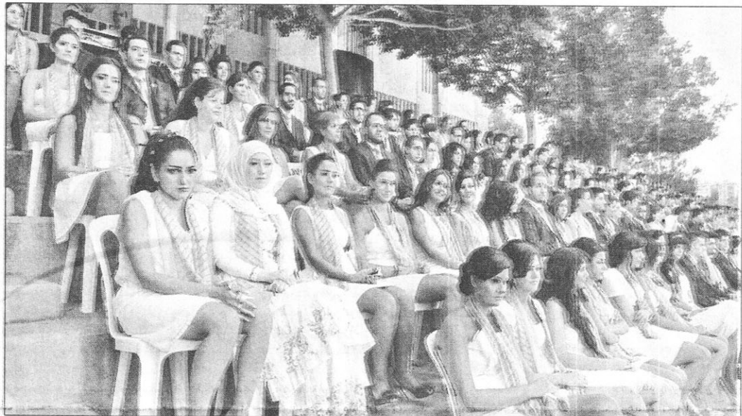
متخرجات في ادارة الاعمال

أعزائي المتخرجين، أنتم تعلمون أننا نعيش في عالم قاس ووسط أزمات ومواجهات صعبة. ويحلبنا هذا العالم إلى ضرورات يجب أن تعرفوا كيفية اختبارها. عسى أن تواجهوا الواقع القائم بتضامكم مع بعضكم بعضاً. فيجب أن تشدوا أزركم حين لا تسير الأمور على ما يرام. عسى أن تحافظوا على الحرص على البحث وعلى السعي إلى بلوغ الأفضل لمواجهة العدائية. عسى أن تقبلوا خوض المجهول وكل ما هو جديد وأن تكونوا مبتكرين