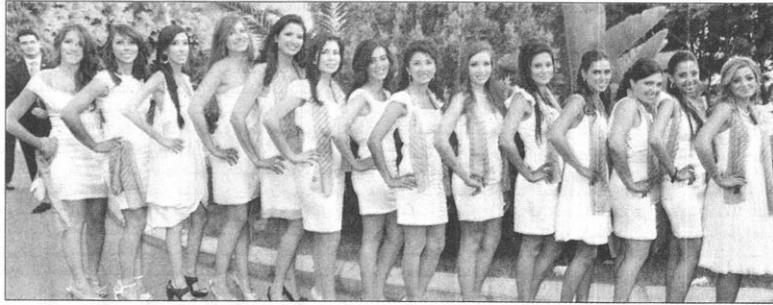
خريجات خلال الحفل

إنجازات مهمة. فأنتم مدعوون جميعكم أن تحذوا حذوهم. يترتب عليكم أن تحذوا موقعكم بشجاعة لمواجهة، بكل ما أوتيتهم من قوة، انغلاق الإنسان على نفسه واحتيايل رواد الأعمال غير التزيهين وتحجر رجال الماضي. وإن وصلتكم إلى هذه المرحلة، فهذا يعني أنكم قادرين على ذلك.