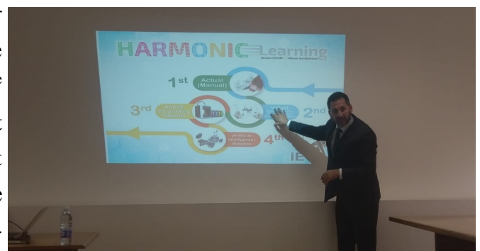
En plein débat sur les défis éducatifs

La journée du jeudi 11 octobre 2018 a été marquée par un événement scientifique important. Des experts de « Microsoft » ont assuré un séminaire sur « La 4 e révolution industrielle ». Enseignants, responsables et chefs de Départements de la Faculté ont participé à cet événement qui a porté sur les enjeux majeurs de l'internet des objets, du Big Data, de l'intelligence artificielle, de la réalité virtuelle augmentée et mixte ainsi que sur l'apprentissage automatique de la robotique en matière d'éducation.