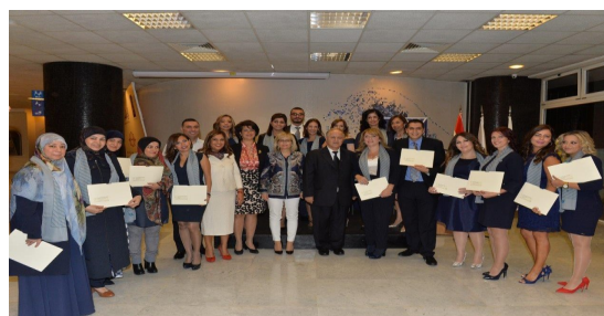
La photo de promotion

pants aux DU deviennent non seulement des experts en la matière, mais des acteurs-connaisseurs sur les plans moral, éducatif, entrepreneurial, communicationnel, légal, etc.