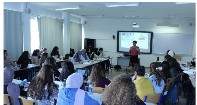
Atelier de Mme Pascale Toscani