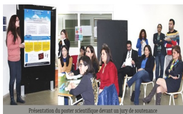
Présentation du poster scientifique devant un jury de soutenance

■ Dans le cadre du Carrefour d'échanges-étudiants semestriel organisé par la Faculté des sciences de l'éducation, des étudiants ont soutenu leurs projets de Mémoire au premier et au second semestre. Ces projets de Mémoire, réalisés à la suite du « Séminaire de Master recherche en sciences de l'éducation », ont été exposés sous forme de posters scientifiques.