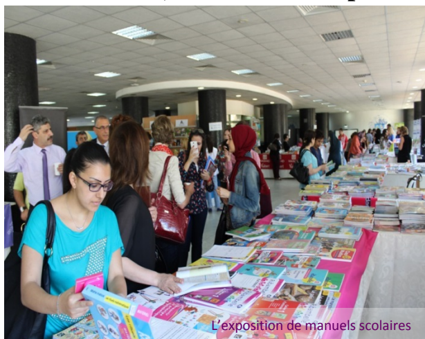
L'exposition de manuels scolaires

■ De nouvelles journées pédagogiques ont été mises en place par la Librairie Antoine, la Faculté des sciences de l'éducation et l'Institut libanais d'éducateurs. Cette deuxième édition intitulée « Les journées pédagogiques 2014 » a eu lieu les 13 et 14 mai 2014, au sein du Campus des sciences humaines.