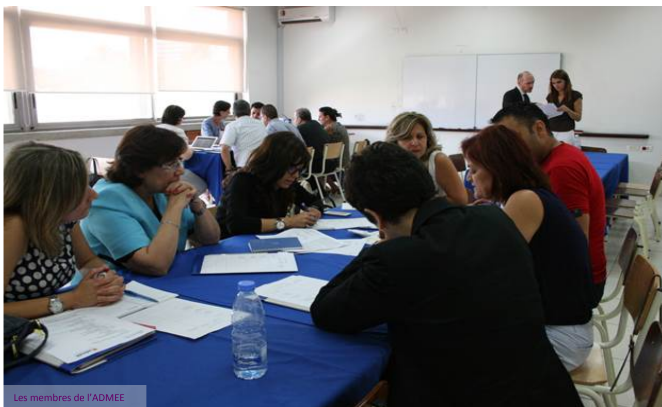
Les membres de l'ADMEE