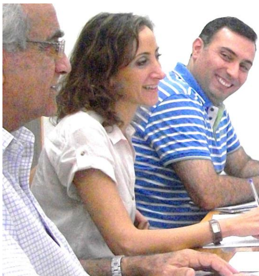
Les coordinateurs des stages

La Faculté des sciences de l'éducation souhaite remercier tous les établissements scolaires partenaires des stages qui ont permis aux étudiants d'acquérir une large expérience et de bénéficier d'un accompagnement de qualité.