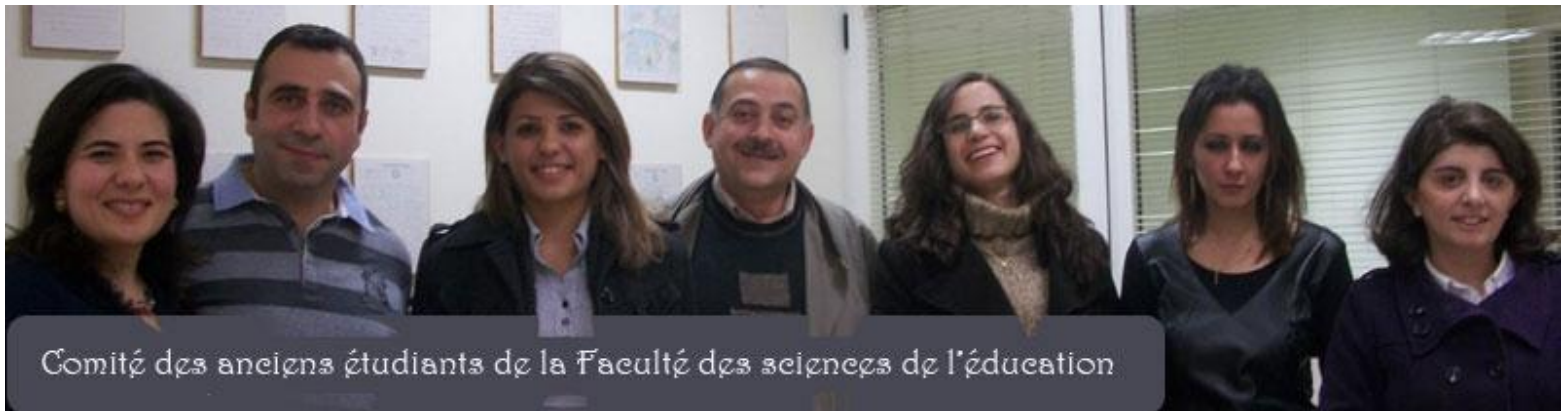
Comité des anciens étudiants de la Faculté des sciences de l'éducation

Une séance de cinééducation est prévue pour mars 2013. Le film choisi : « Entre les murs ».