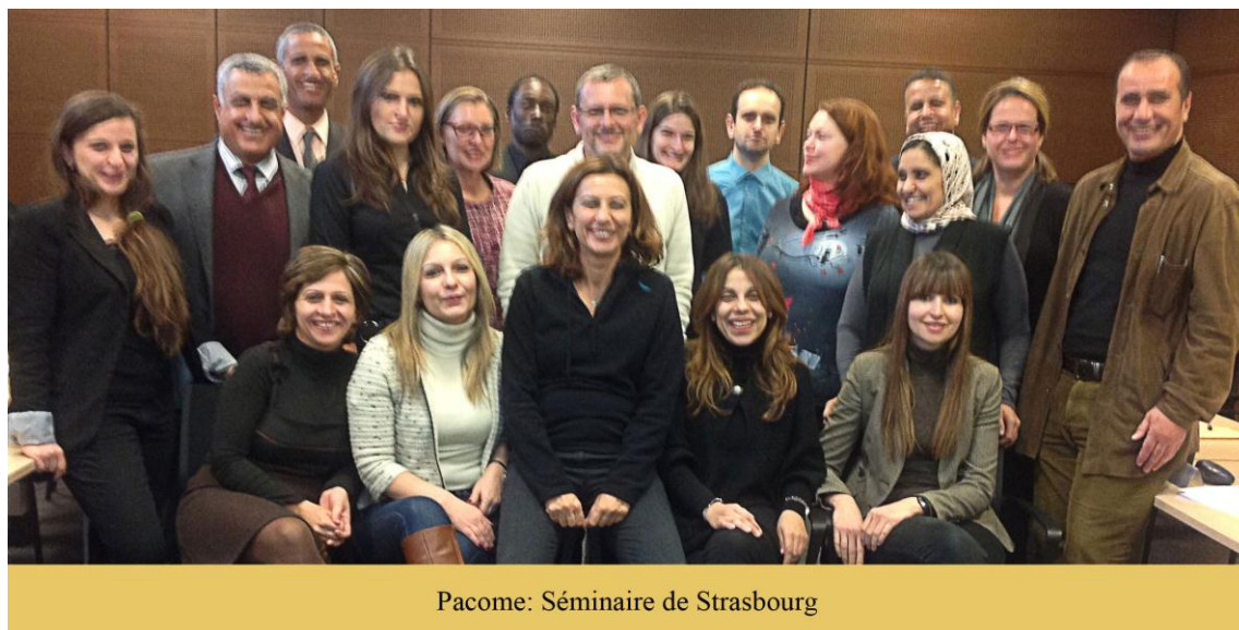
Pacome: Séminaire de Strasbourg

Les résultats du projet seront diffusés en vue d'une généralisation des approches méthodologiques de l'adéquation entre l'offre et la demande en compétences, et en vue de pérennisation des actions de promotion de l'employabilité et de l'insertion professionnelle. Des universités de l'UE et des pays partenaires, Ministères et partenaires socio-économiques du Maroc et du Liban sont impliqués dans ce projet de trois années.