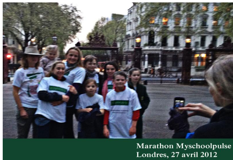
Marathon Myschoolpulse Londres, 27 avril 2012

MSPe est un beau projet de collaboration entre enseignants de différentes disciplines pour apporter l'école à la maison ou à l'hôpital et éviter le décrochage scolaire.